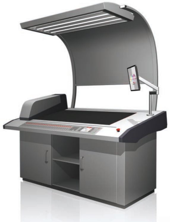
*中央控制台集成KICS墨色自动控制系统控制台功能（选配）

CCIES 印品整版质量检测系统配备先进的印品整版质量检测机，系统采用彩色线阵 CCD 相机进行图像扫描，获得印品表面真实图像信息。利用专用图像分析处理软件将色彩信息与标准模板进行对比，自动计算墨量调节值，将该值发至墨色自动控制系统，控制墨键运行到指定位置。同时可对多种质量控制参数进行分类统计、分析、保存，并可对印品质量缺陷进行报警提示，实现全闭环印品质量控制。